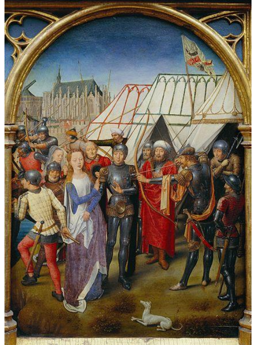
Hans Memling: Szent Orsolya mártírhalála