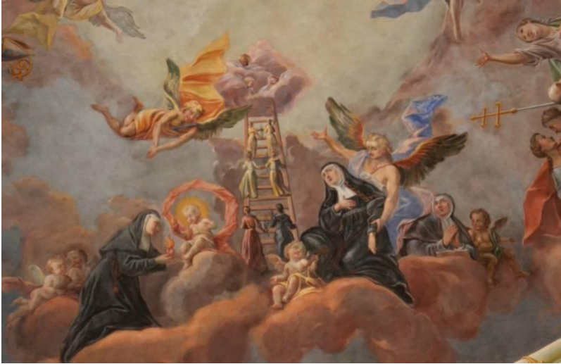
A Szent Orsolya Rend győri Szent Anna templomának mennyezetfreskója.